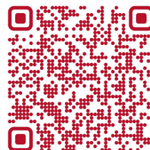
Info o parkovacích zónách v Praze