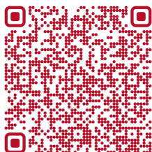
Info o parkování na Kotlářce

U divadla není možné parkovat. Využijte, proto buď parkování na Kotlářce, nebo parkování v okolí divadla. Dále se dá zaparkovat u Klubu Klamovka, kde je rovněž i ubytování.